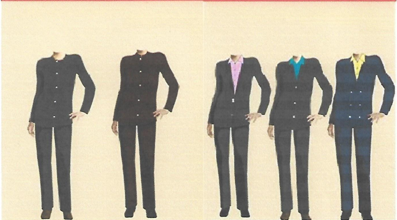
Three Piece Suit Pants